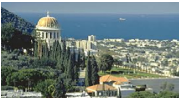
DIA 03 TEL AVIV / CESAREA / HAIFA / NAZARET / GALILEA

Desayuno. Por la mañana salida hacia Jaffa: barrio de los artistas y monasterios de San Pedro, el museo de la Diáspora. Regreso a Tel Aviv para realizar la visita panorámica de la ciudad: la calle Dizengoff, el Palacio de la Cultura, Museo de Tel Aviv. Tarde libre. y alojamiento