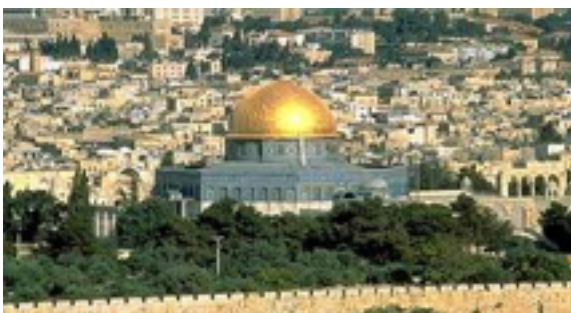
DIA 04 GALILEA / JERUSALEM

Desayuno. Salida a Cesarea y vista: teatro romano, ciudad de los cruzados y acueducto. Continuación a Haifa, visita del Santuario Bahai y jardines persas. Vista panorámica desde la cima del Monte Carmelo y vista al monasterio carmelita y San Juan de Acre para ver la fortificación medieval. Por la tarde, salida a Nazaret y visita de la Basílica de la Anunciación, la carpintería de San José y la fuente de la virgen. Seguiremos atravesando las montañas de Galilea hasta un Kibutz. Alojamiento