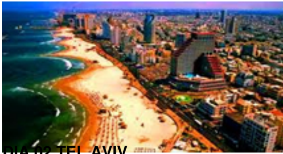
DIA 02 TEL AVIV

Desayuno. Por la mañana salida hacia Jaffa: barrio de los artistas y monasterios de San Pedro, el museo de la Diáspora. Regreso a Tel Aviv para realizar la visita panorámica de la ciudad: la calle Dizengoff, el Palacio de la Cultura, Museo de Tel Aviv. Tarde libre. y alojamiento