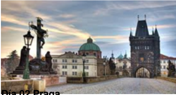
Día 02 Praga.

Desayuno. Por la mañana visita de la ciudad recorriendo el Castillo, Catedral de San Vito, el pintoresco Barrio Pequeño "Mala Strana", Iglesia de la Victoria del Niño Jesús de Praga, Puente de Carlos, Ciudad Vieja y Reloj Astronómico. Tarde libre. Alojamiento.