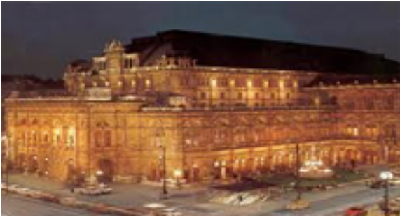
Día 03 Praga

Desayuno. Por la mañana visita de la ciudad recorriendo el Castillo, Catedral de San Vito, el pintoresco Barrio Pequeño "Mala Strana", Iglesia de la Victoria del Niño Jesús de Praga, Puente de Carlos, Ciudad Vieja y Reloj Astronómico. Tarde libre. Alojamiento.